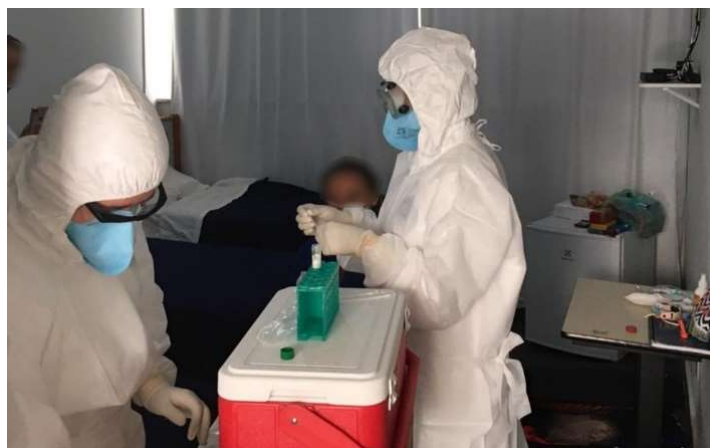
Equipes fazem testes para detectar coronavírus em Goiás

1- Observe as imagens a seguir e responda as atividades no seu caderno.