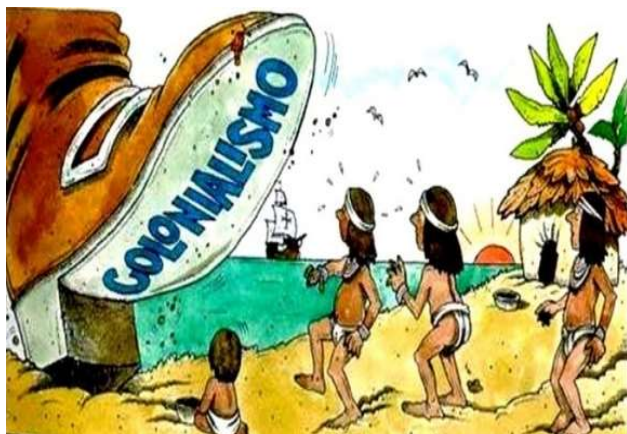
Disponível em: https://tinyurl.com/colonialismo Acesso em: 22 de mar. de 2020.

A maioria dos países que compõem o continente africano apresenta muitas similaridades com o Brasil. Primeiramente, os aspectos naturais de ambos têm em comum a presença de extensas áreas florestadas, como a Amazônia brasileira e a Floresta Equatorial do Congo. Em seus territórios estão localizados os dois maiores rios em volume de água do mundo, o rio Amazonas e o rio Congo, respectivamente. Outro ponto em comum são as enormes faixas de clima tropical recobertas por vegetação esparsas, conhecida como Savanas, na África, e Cerrado, no Brasil. Na literatura de língua inglesa, o Cerrado é conhecido como Brazilian Savanna , ou seja, a Savana Brasileira.