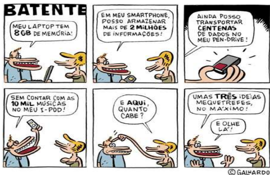
Tirinha sobre as evoluções tecnológicas contemporâneas