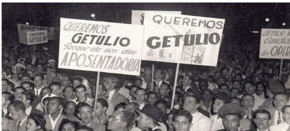
Comício queremista no Largo do Carioca. Rio de Janeiro: 1945

05. Leia as imagens a seguir e responda aos questionamentos.