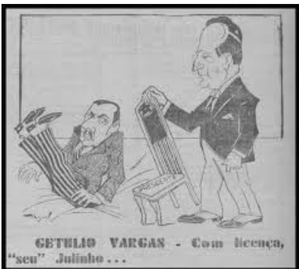
Getúlio Vargas – Com licença, “seu” Julinho...

04. De acordo com o texto lido, a charge de 1930 a seguir, retrata um momento decisivo da história brasileira. Explique esse acontecimento retratado.