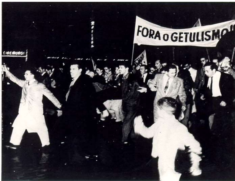
Manifestação anti-getulista realizada na Praça da Sé. São Paulo: 1945.