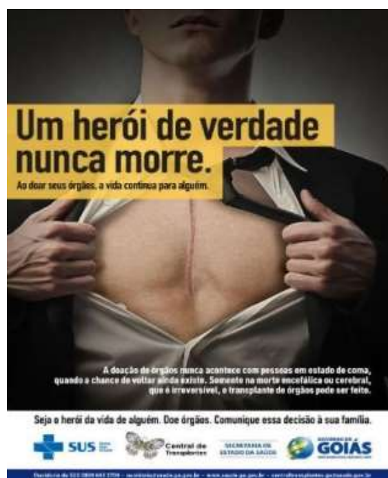
Exemplo de Cartaz com Função apelativa