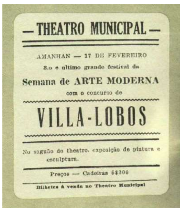
Exemplo de Cartaz com Função Informativa