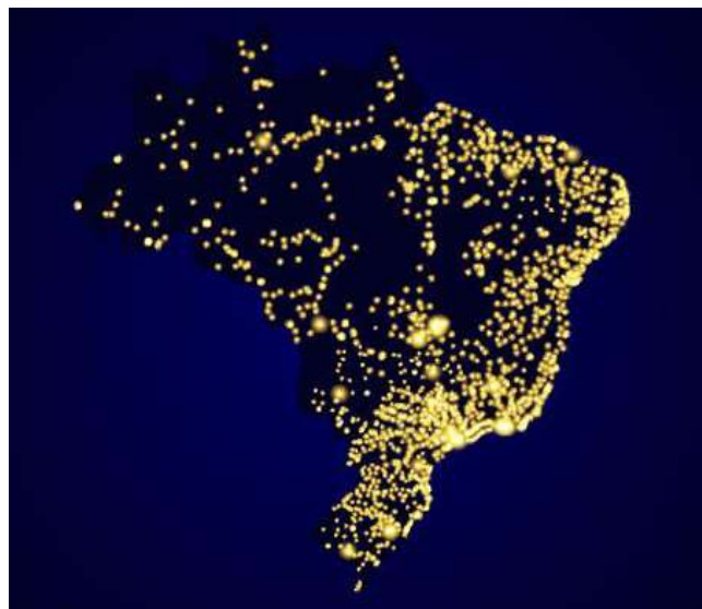
Projeção da visão noturna do território brasileiro visto do espaço

Disponível em: https://escolakids.uol.com.br/geografia/distribuicao-da-populacao-brasileira.htm Acesso em: 20 de maio de 2020