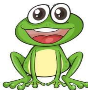
Imagem disponível em:

https://portalescolainfantil.blogspot.com/2016/02/folclore-trava-linguas.html Acesso em 08 de set. de 2020