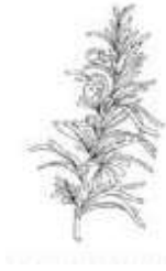
flor do campo

a) De acordo com o texto, o que é um alecrim? Pinte a imagem correspondente: