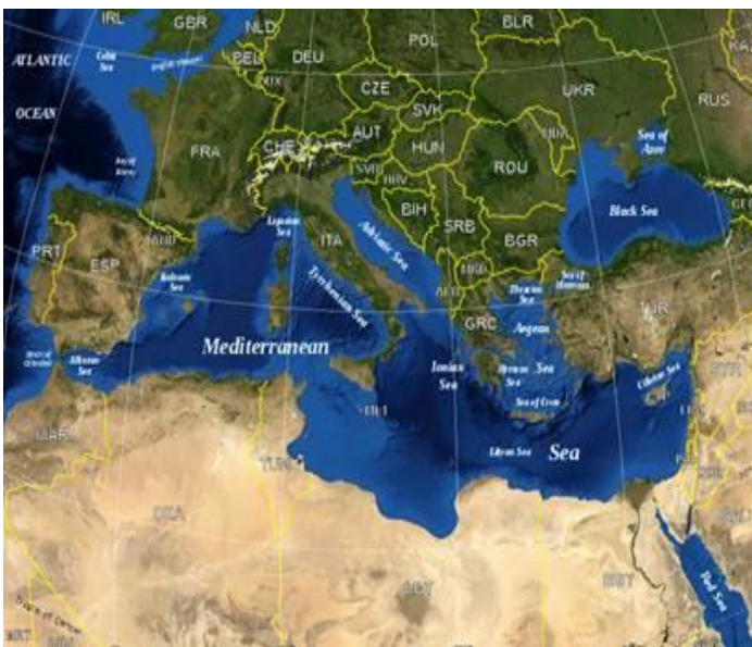
Imagem de satélite do mar Mediterrâneo .

Apesar de estarem ligados ao oceano através de estreitos e canais, encontram-se quase totalmente envolvidos por terra. Como exemplo citamos o Báltico, Vermelho, Negro e Mediterrâneo .