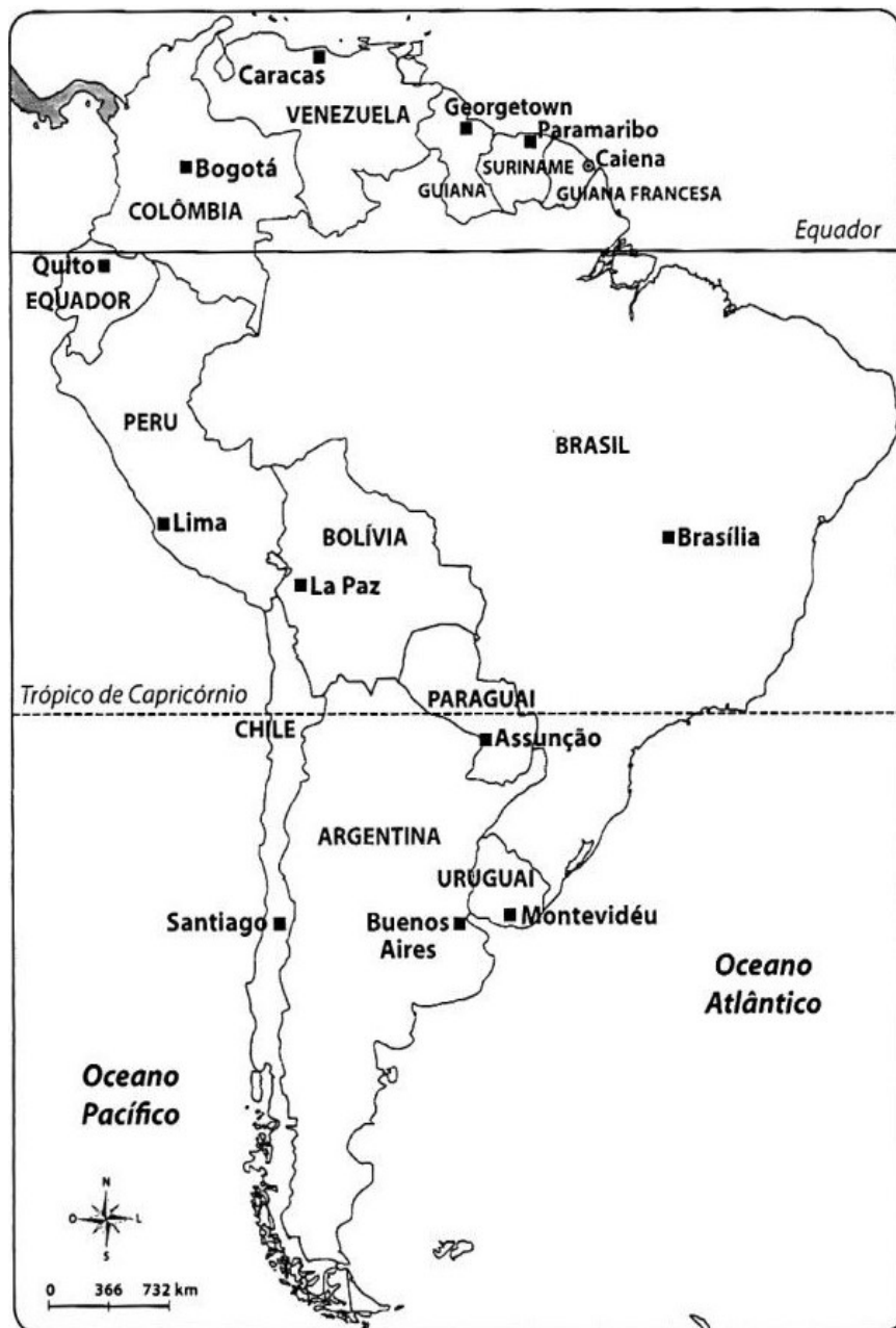
Mapa Político da América do Sul, sendo este um subcontinente do continente americano.

k) cite três países que estão na região sul da América do Sul.