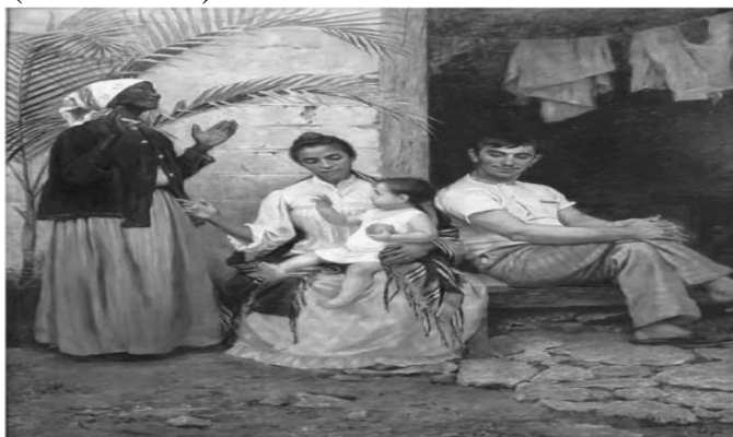
BROCOS, R. A redenção de Cam, 1895. Disponível em: http://mnba.gov.br . Acesso em: 13 jan. 2013.

Na imagem, o autor procura representar as diferentes gerações de uma família associada a uma noção consagrada pelas elites intelectuais da época, que era a de