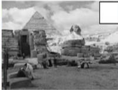
Pirâmides do Egito