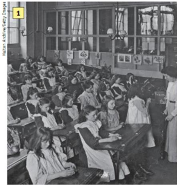
Sala de aula em Londres, Inglaterra, em 1908.