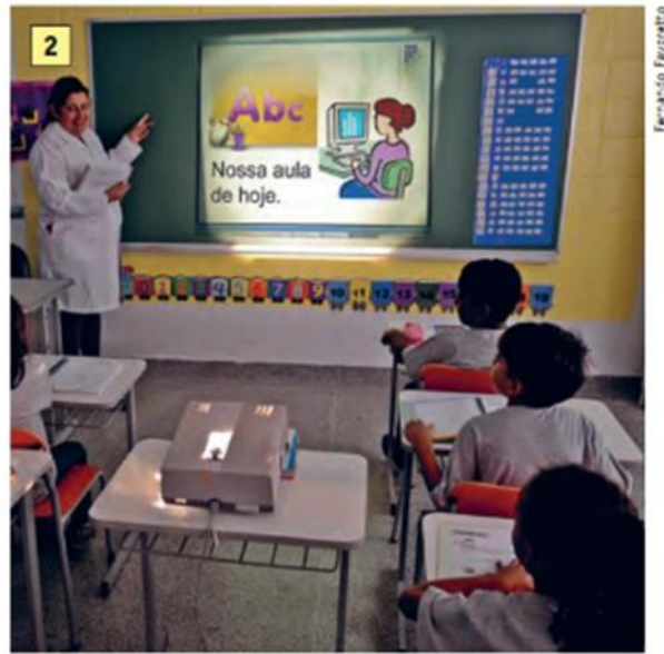
Sala de aula em São Paulo, Brasil, em 2015.

Disponível em: https://issuu.com/editoraftd/docs/6-ano-historia-sociedade-cidadania_8d2d046be8e765/25 Acesso em: 13 de abril de 2020.