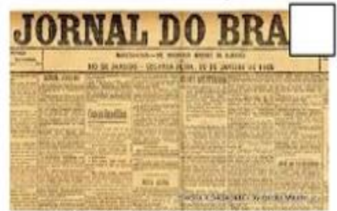
Jornal do Rio de Janeiro de 1905

Disponível em: https://pt.scribd.com/document/403474599/1%C2%AA-Atividade-avaliativa-de-historia-2019-docx Acesso em: 16 de out de 2020.