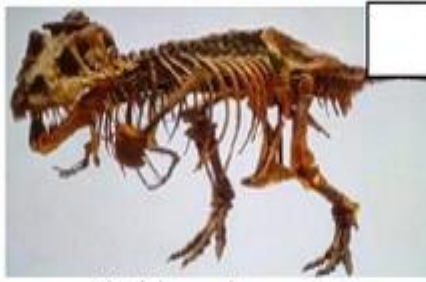
Fóssil de um dinossauro