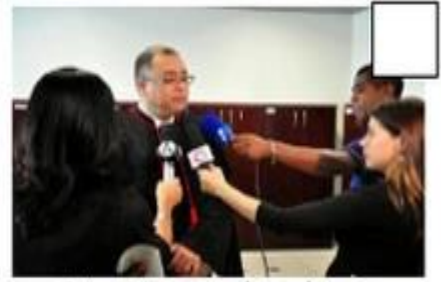
Entrevista a um advogado