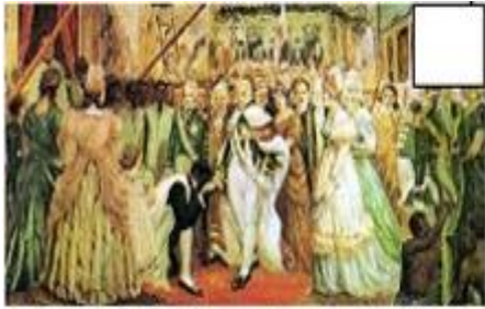
Pintura da família real portuguesa