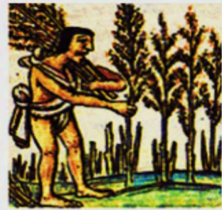
Índigena asteca realizando colheita. Códice Florentino, México, século XVI. Apesar de terem construído cidades, a agricultura era a base da economia das sociedades pré-colombianas. Os principais produtos cultivados eram a batata e o milho.

As terras agrícolas pertenciam ao Estado, que as dividia em lotes distribuídos entre as famílias. Estas, porém, eram obrigadas a cultivar também as terras pertencentes ao poder central e aos sacerdotes, além de trabalhar na construção de obras públicas e de participar das guerras.