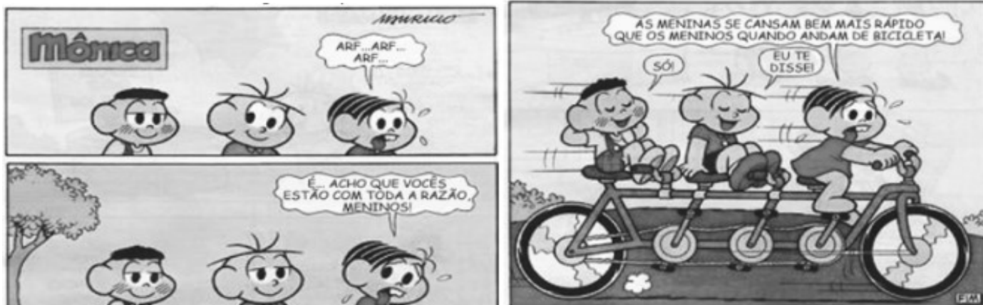
Turma da Mônica. Historinhas de uma página, n. 5, p. 57.

Leia o texto, a seguir, e responda as atividades 5, 6 e 7.