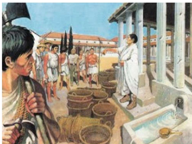
Na Grécia só teria tempo para participar das assembleias aqueles homens que tivessem escravos

9. Na Grécia Antiga, só teria tempo para participar das assembleias, aqueles homens que tivessem escravos. Com base no texto e na imagem a seguir justifique esta afirmativa.