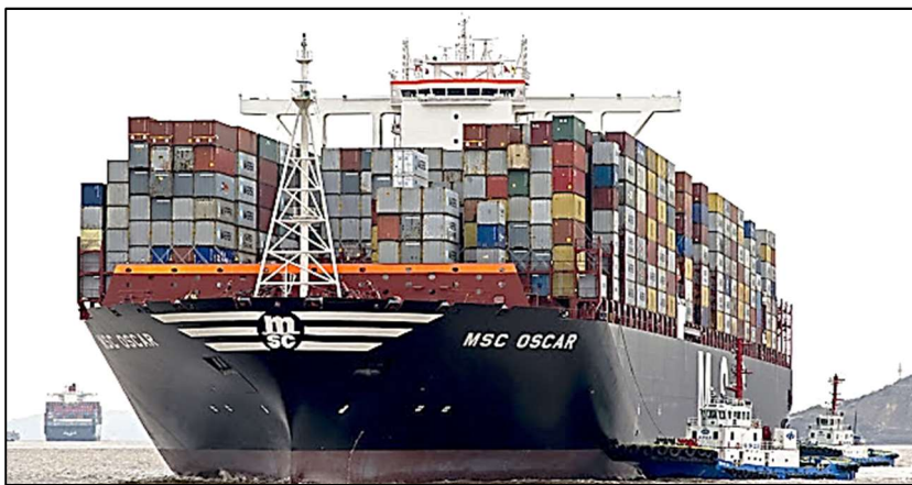
Disponível em: https://www.bloglogistica.com.br/mercado/conheca-o-maior-navio-de-containers-do-mundo/ Acesso em: 23 de jun de 2021.

A Revolução Técnico-Científica-Informacional deu novos contornos à dinâmica dos transportes, permitindo a modernização dos meios já existentes e a criação de novas formas de deslocamento ao longo do espaço geográfico. Se, nos primeiros tempos, viagens em curtas distâncias levavam dias, atualmente os voos mais longos do mundo levam algumas horas (sem considerarmos as escalas e conexões) para efetuarem-se.