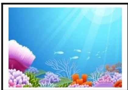
FUNDO DO MAR

OBSERVE AS IMAGENS DE DIFERENTES AMBIENTES E LEIA O NOME DE ALGUNS SERES VIVOS QUE HABITAM ESTES LOCAIS.