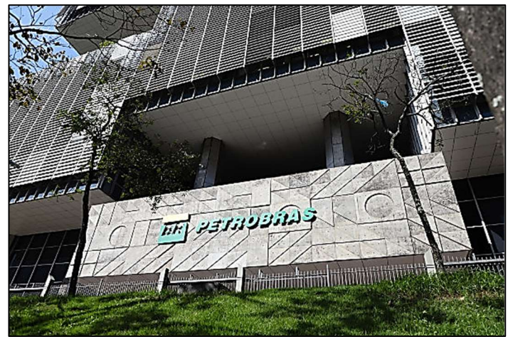
Sede da Petrobras – Brasil

No terceiro período, que ocorreu de 1930 a 1955 , foram observados maciços investimentos no setor industrial , oriundos tanto de iniciativas privadas quanto do governo brasileiro, na tentativa de alavancar o setor. Foram realizados avanços no setor de transportes, com aberturas de ferrovias e rodovias. Observou-se também o desenvolvimento do setor energético no Brasil e de logística. Foi instalada a Companhia Siderúrgica Nacional , entre 1942 e 1947, que contribuiu para a oferta de matéria-prima para a indústria no país. Em 1953, foi criada a Petrobras , maior empresa estatal do setor energético petrolífero do Brasil.