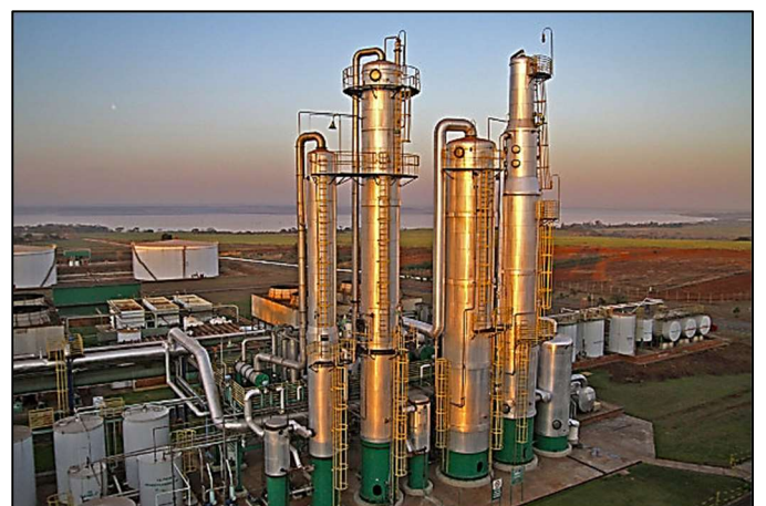
Indústria de produção de etanol – Brasil

O Brasil, a partir daí, pôde conhecer o mercado de consumo externo e integrar-se aos processos de exportação e comércio global . Alguns setores industriais não sofreram tantos investimentos, como o de tecnologia de ponta, o que tornou o Brasil um país dependente econômica e tecnologicamente de outras economias globais.