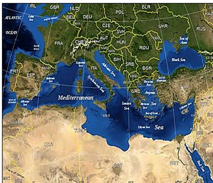
Imagem de satélite do mar Mediterrâneo.

Apesar de estarem ligados ao oceano através de estreitos e canais, encontram-se quase totalmente envolvidos por terra. Como exemplo citamos o Báltico, Vermelho, Negro e Mediterrâneo .