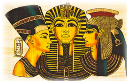
Imagem disponível em: https://i.pinimg.com/originals/9e/57/f5/9e57f5b5ef2d793ef0108cf2272e7220.png Acesso em: 02 de set. de 2021.