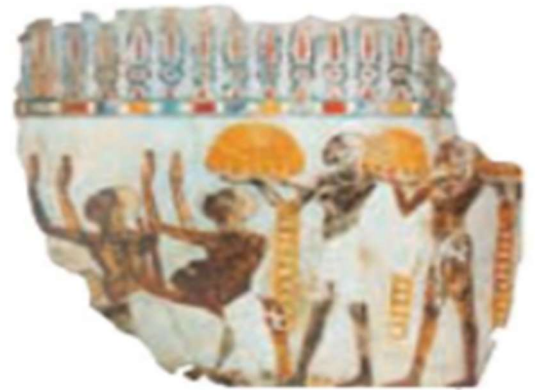
Nas imagens são representados produtos oferecidos aos egípcios: ouro, pedras preciosas, plumas e ovos de avestruz, macacos, marfim, babuínos, incenso, toras de ébano, peles de leopardo.

No entanto, a prosperidade de Cartago fez com que a cidade-estado entrasse em choque com outra superpotência, Roma. As lutas entre cartagineses e romanos ficaram conhecidas como Guerras Púnicas. Ao final da Terceira Guerra Púnica, Cartago foi incendiada, dizimada e o seu chão foi salgado, para que nada nele crescesse. Era o ano de 146 a.C quando chegou ao fim o Império e a hegemonia de Cartago na região.