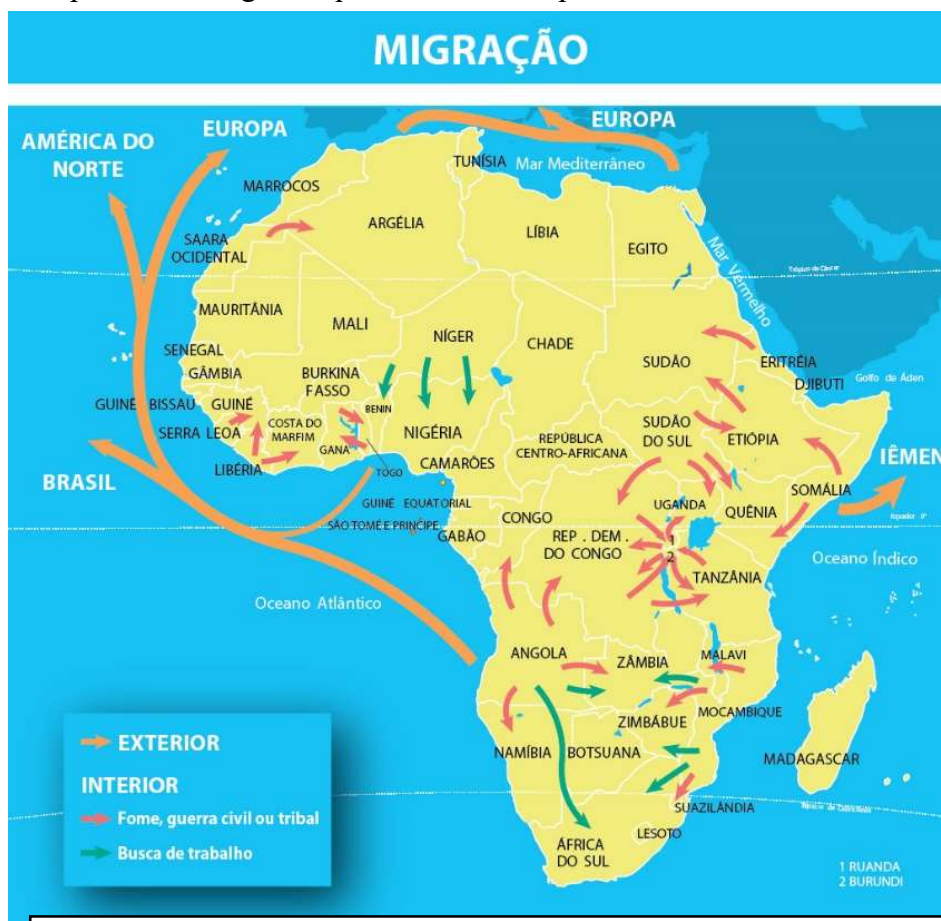
Figura 1: Mapa temático do Continente Africano: Migração - Boligian 2012

Mesmo possuindo os mesmos elementos, os mapas não são todos iguais, existem tipos diferentes de se representar uma determinada porção do espaço. Assim, temos os mapas temáticos, que costumam ser divididos em: econômicos, políticos, demográficos, históricos e físicos, além daqueles estilizados. Os mapas físicos são utilizados para representar o espaço físico de um determinado ambiente, apresentando informações como os rios, o relevo, a vegetação, a altitude, entre outros elementos. Os econômicos são aqueles que representam as atividades produtivas e financeiras, trazem informações e dados socioeconômicos, como a pobreza, a fome, entre outros fatores. Os mapas políticos são os que representam a distribuição dos territórios nacionais, com as fronteiras que delimitam os países e as divisas entre os estados, cidades ou províncias. Já os mapas demográficos são aqueles utilizados para representar temas referentes às populações, como número de habitantes, concentração de moradias, divisão de agrupamentos étnicos e densidade demográfica.