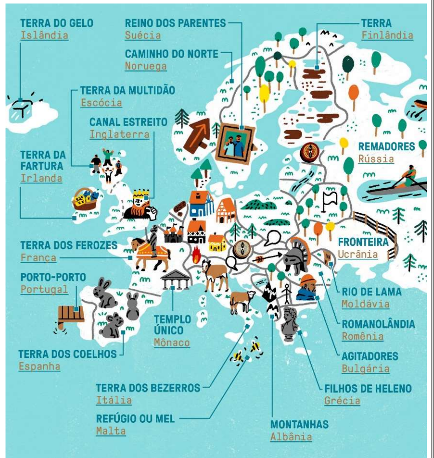
Atlas Etimológico Europa. Disponível em: https://super.abril.com.br/especiais/atlas-etimologico/ - Acesso: 03 setembro de 2021.

O domínio europeu no mundo teve início durante os séculos XV e XVI, por meio da busca da expansão de seu território, isso foi possível através das grandes navegações, no qual se fazia necessário extrair riquezas em outros continentes para suprir as necessidades do mercado em constante expansão, uma vez que crescia o número da população. Por terem desenvolvido os aspectos político e cultural em âmbito interno, conseguiu implantar sobre os outros povos domínio, pois detinham conhecimento em ciências, estratégia militar e tecnologias.