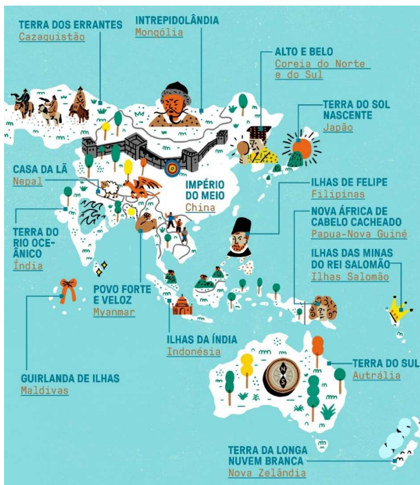
Atlas Etimológico Ásia e Oceania. Disponível em: https://super.abril.com.br/especiais/atlas-etimologico/ - Acesso: 03 setembro de 2021.

6. O atlas abaixo é etimológico, ou seja, se refere à origem dos nomes de países do continente Asiático e Oceania. Análise e responda os itens a seguir: