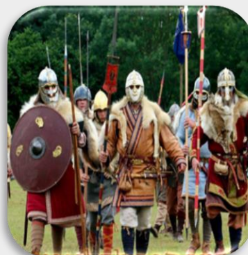
Imagem 1 disponível: http://3.bp.blogspot.com/_XyGefuuJv6k/S4hYsuZm2RI/AAAAAAAAAZO/t-kk-A-ulaM/s320/EVALDO+feudalismo.jpg Acesso em: 15 de set. de 2021.

Imagem 2 disponível em: https://4.bp.blogspot.com/_92z_XiYbAYg/W6hhtmlQqLI/AAAAAAAAABkA/cAr_f7LS_Lo9cOSuaOBWvWltJyw68i7yQCPcBGAYYCw/s1600/1004587_377319769056514_1051454578_n.jpg Acesso em: 15 de set. de 2021.