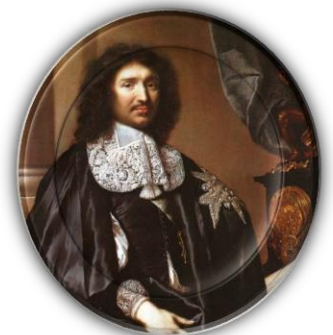
Jean-Baptiste Colbert. Pintura de Claude Lefèvre, 1666.

Este termo se refere à política econômica dos reinos europeus absolutistas. O mercantilismo tem três características centrais: intervenção do Estado, metalismo e colonialismo. Os principais nomes desta política são: Jean-Baptiste Colbert (1619 - 83), ministro das Finanças do rei Luís XIV (1638 - 1715), Thomas Mun (1571 - 1641), diretor da Companhia das Índias Orientais, e Antonio Serra (c. 1550 – c. 1600), economista e filósofo italiano.