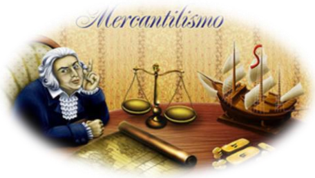
Imagem disponível em:

( ) forma praticada pelos espanhóis que, pelo fato de possuírem colônias produtoras de metais preciosos, importavam manufaturas e alimentos e exportavam esses metais (pagamento em moedas de ouro e prata)