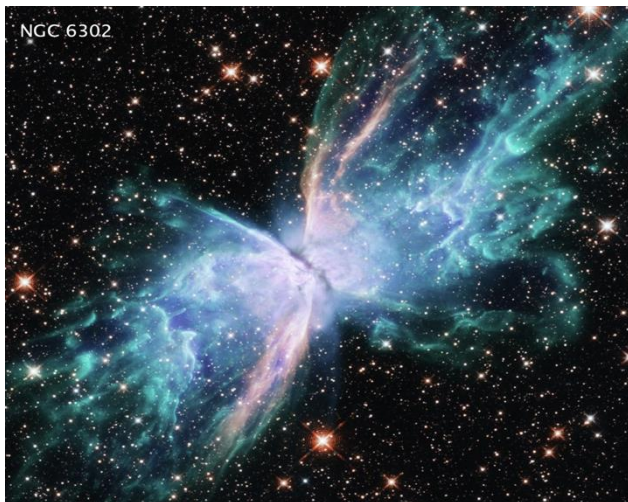
Nebulosa captada pelo Hubble.

Até o começo do século XX acreditava-se que estas manchas longas e difusas no espaço com um brilho intenso no meio eram apenas aglomerados de estrelas, os quais receberam o nome de “nebulosas” e foram catalogadas às centenas até que em 1923, Edwin Powell Hubble, conseguiu provar definitivamente que as tais nebulosas de formato espiral eram na verdade objetos extra galácteos (fora da nossa galáxia). Ou seja, eram galáxias completamente independentes.