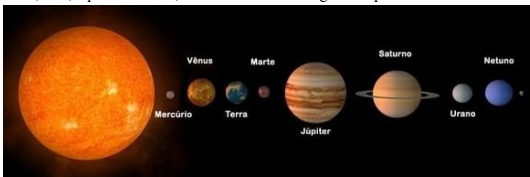
Planetas do Sistema Solar. Disponível em: < https://tinyurl.com/5y8ate8j >. Adaptado. Acesso em 22 set. 2021.

Os oito planetas do Sistema Solar, em ordem de proximidade ao sol, são: Mercúrio, Vênus, Terra, Marte, Júpiter, Saturno, Urano e Netuno. Os planetas anões são: Ceres, Plutão, Haumea, Makemake e Éris, com a possibilidade de inclusão de dezenas de outros nessa categoria nos próximos anos. Plutão já foi considerado como um planeta, mas, a partir de 2006, foi “rebaixado” à categoria de planeta anão.