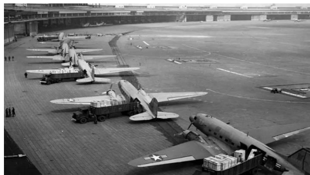
A União Soviética bloqueou todas as rotas terrestres que davam acesso a Berlim, quando a Alemanha aderiu ao Plano Marshal, se aliando aos Estados Unidos.

A Guerra Fria recebeu esse nome porque as disputas se deram apenas nas esferas ideológica, política, militar, tecnológica, econômica e social entre as duas potências e suas zonas de influência. Durante mais de 40 anos não houve embate direto entre as duas nações.