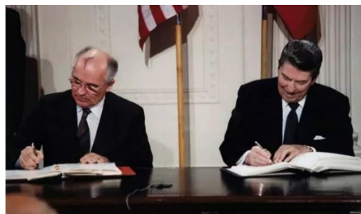
Presidente dos EUA, Ronald Reagan e secretário-geral da URSS assinam Tratado de Forças Nucleares de Alcance Intermediário, em 1987.