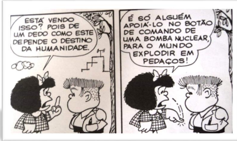
Imagem disponível em: https://miro.medium.com/max/1838/1*ZC9xz15wk5kQK6URWOGi1g.jpeg . Acesso em 28 de set. de 2021.

2. A Guerra Fria e a Corrida armamentista ao logo da 2ª metade do século XX, representaram grandes perigos reais ao planeta Terra e a humanidade. De acordo com o quadrinho a seguir e o texto discorra as principais consequências deixadas pela Guerra Fria.