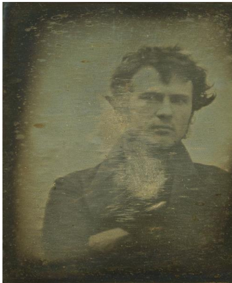
Robert Cornelius, em 1839. Acredita-se que esta seja a primeira selfie da história da humanidade.

Leia o texto e, a seguir, responda às atividades propostas.