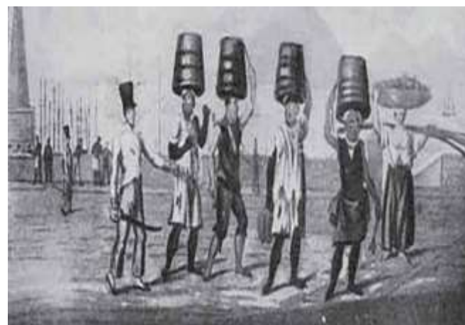
EIGENHEER, E. M. Lixo: a limpeza urbana através dos tempos . Porto Alegre: Gráfica Palloti, 2009.