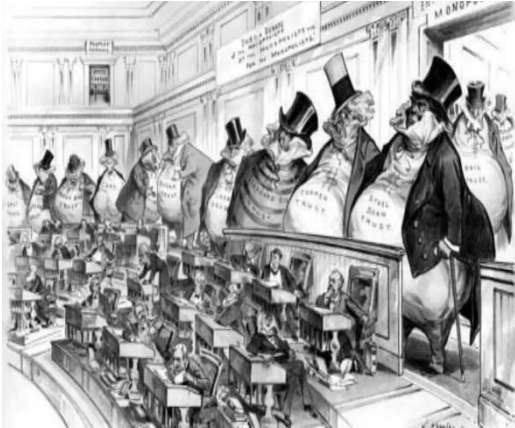
Disponível em: https://cutt.ly/oRgfb9 Acesso em: 18 mai 2022.

A partir desta charge, é possível compreender o exercício do poder econômico das grandes corporações empresariais, no sentido de submeterem o aparato burocrático dos estados nacionais aos seus interesses.