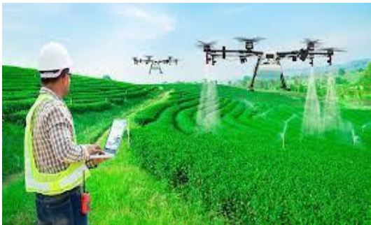
Disponível em: https://bitly.com/eFjLgEB . Acesso em 13 set. 2022.

SOUZA, Ana Hilda Carvalho de. et al. A relação dos indígenas com a natureza como contribuição à sustentabilidade ambiental: uma revisão da literatura. Disponível em: https://bitly.com/olfYQsy . Acesso em: 13 set. 2022.