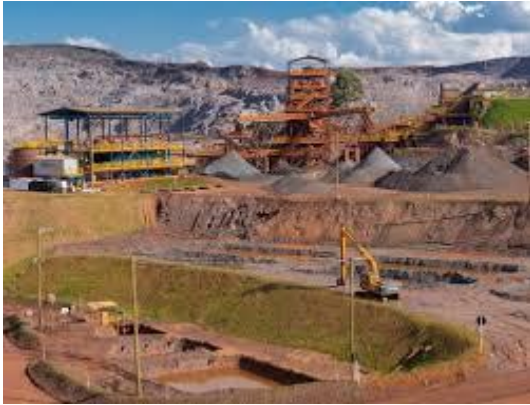
Disponível em: https://bitly.com/CiYqYdz . Acesso em: 3 set. 2022.