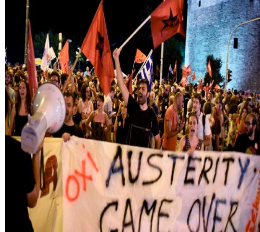
Disponível em: https://cutt.ly/uClur3Z Acesso em: 09 set 2022.